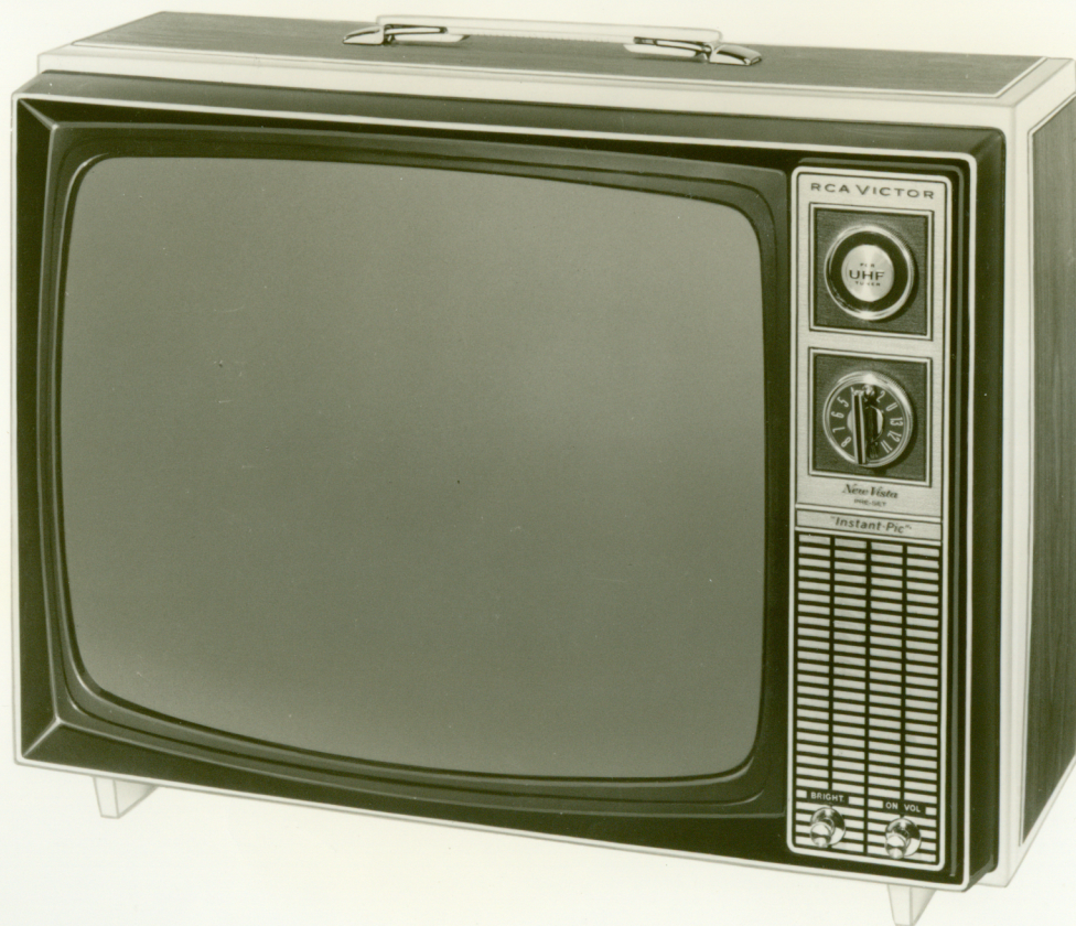
Model No. TP-9916B